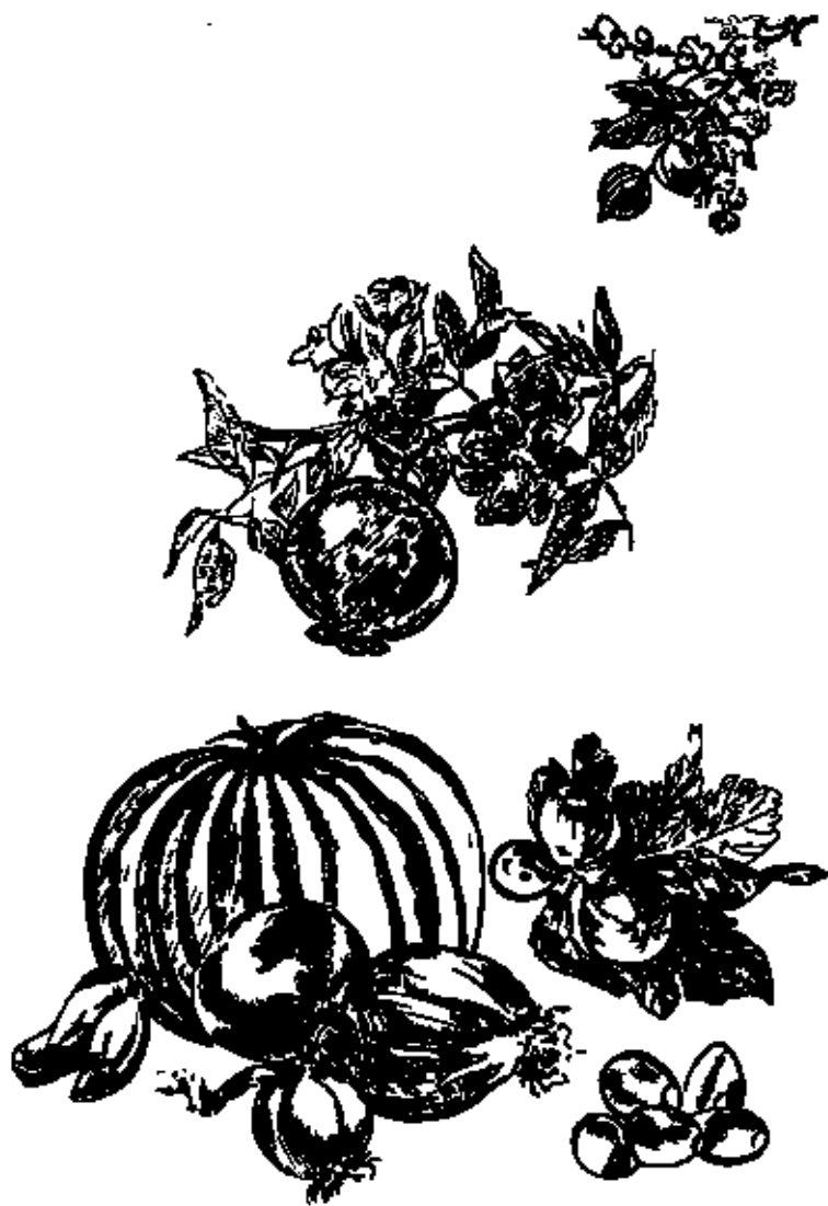
Amandes, grenades, figues, melons, pommes, oignons et olives garnissaient habituellement la table des hommes de la Bible.