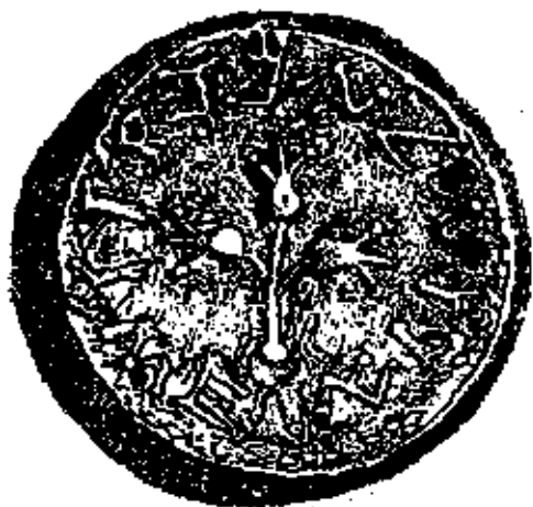
Pièces de monnaie juive. I er s. ap. J-C.