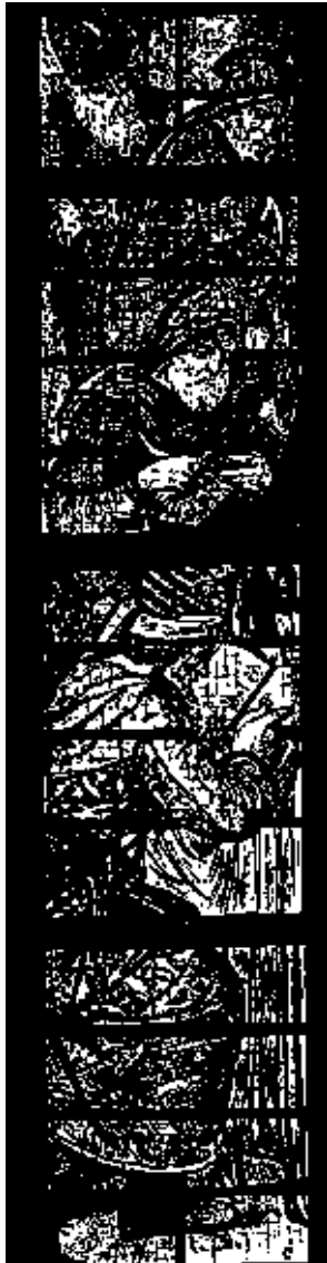
Groupe de pharisiens. Vitrail de l'Église St Jean. Gouda. Pays-Bas. XVI e s.